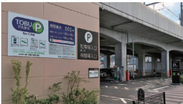
東武沿線の他、1都5県140カ所の時間貸駐車場を運営。