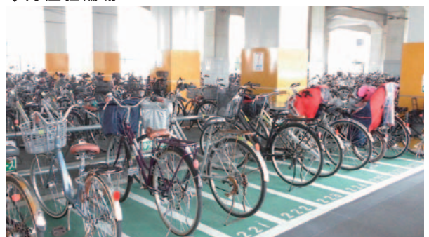
有人管理駐輪場(35カ所)の一部では、幅広区画「ゆうゆうスペース」を導入。