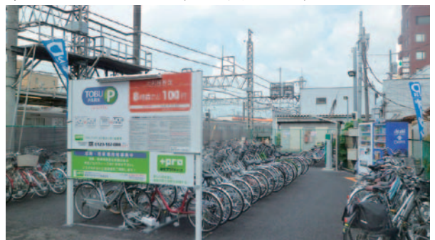
30台から700台規模まで、大小さまざまな時間貸駐輪場110カ所を運営。