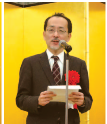
来賓挨拶： 国土交通省都市局街路交通施設課 渡邊浩司 課長