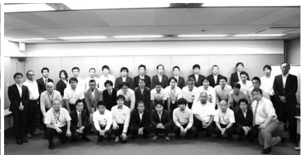
参加者全員で集合写真