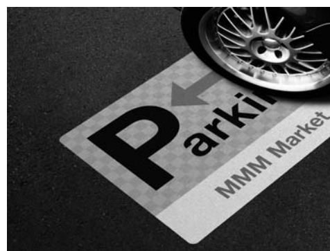
3M™ スコッチカル™ ペイントフィルム CPG-II サイン業界初のタイヤでの据え切りに対応！

塗装ならではの下書きや養生が不要。 また溶剤臭が少ないので近隣への 配慮にも対応。