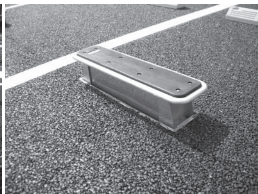
ロック装置上昇時