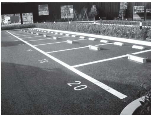
「フラットパークシステム」を導入した駐車場