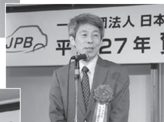
来賓挨拶をされる 清水喜代志国土交通省 大臣官房技術審議官