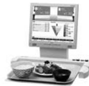
オートレジスター

メニューをのせたトレイを置くだけで、容器の裏についたICチップを読み取り、瞬時に料金を計算する「オートレジスターシステム」をはじめ、メニューごとにプリペイドカードで精算するシステムなど、多彩なバリエーションをご提案します。システム導入により、社員の喫食集計業務の煩わしさから開放されます。