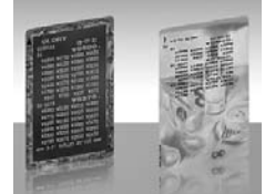
プリペイド/リライトカード