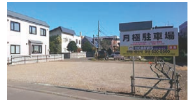
マンスリーパーク

月極駐車場も時間貸し同様『カービスパーク』の名称で札幌市内を中心に展開しております。月極駐車場の多くは無人の屋外駐車場であり風雨や積雪の影響を受けやすい環境にあるため、日々の清掃と保守が重要であります。当社ではクオリティの高い駐車場運営を目指し、高頻度での定期的の巡回と清掃保守作業に取り組んでおります。