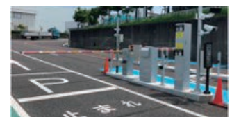
大和リース株式会社 滋賀水口デポ/関西工場

受付・警備の省力化や負担軽減、駐車券などによる管理の煩わしさやコストダウンが図れ、登録車両は入退場時に停車せずノンストップ通行が出来る為、混雑や渋滞の緩和が実現。