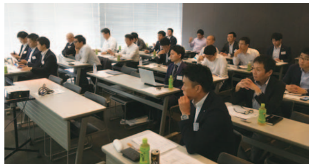
熱心に聞き入る参加者の方々(九州支部研修会)