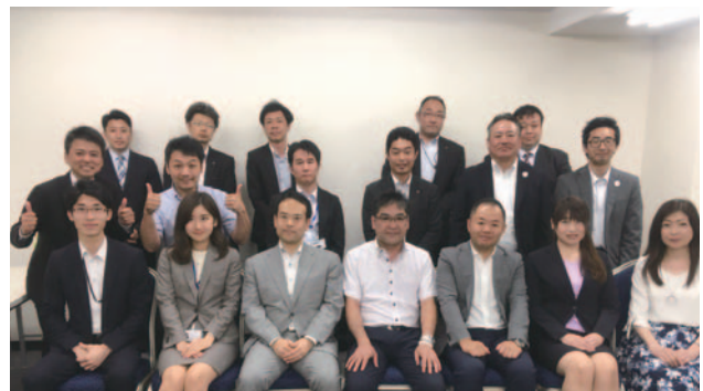
意見交換会における集合写真