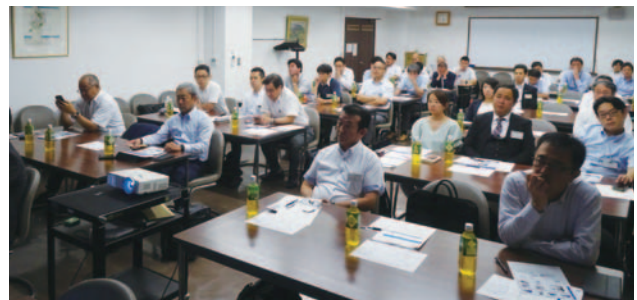
熱心に聞き入る参加者の方々(関西支部研修会)